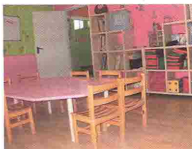
Fotografija 4. Djeca fotografiraju sobe drugih grupa

prostor drugih grupa (71,43%), blagavaonica (50%) i kabinet odgajatelja (35,71%).