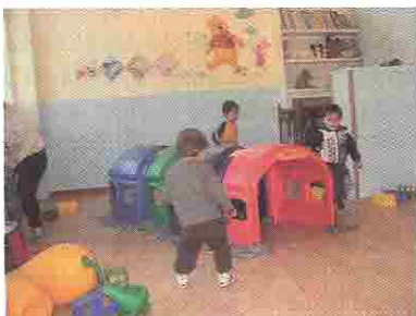
Fotografija 3. Djeca fotografiraju svoje vršnjake