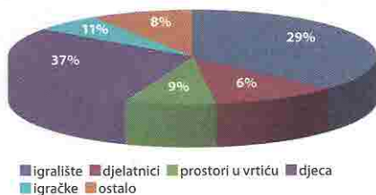
Graf 1. Rezultati upotrebe digitalnog fotoaparata