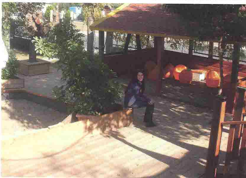
Fotografija 1: Igralište

vrtiću koristili smo upitnike za roditelje i djelomično strukturirani intervjui za odgajatelje. Istraživanje je započelo detaljnim opažanjem svakog djeteta u vrtiću. Potom smo proveli djelomično strukturirani intervjui/rasprave s djecom (u grupama od 3-4). Znajući da djeca otvorenije govore sa svojim prijateljima, preinačili smo metodu tako što smo ulogu osobe koja provodi intervjui dodijelili jednom djetetu iz grupe. Potom su djeca pojedinačno ili u parovima digitalnim fotoaparatima snimala ono što im se u vrtiću sviđa. Fotografije su nekoliko dana kasnije korištene za mapiranje vrtića. Na kraju su djeca, pojedinačno ili s prijateljima (prema vlastitoj želji), povela istraživača u obilazak vrtića. Važno je napomenuti da su bila unaprijed upoznata s ciljem i načinom provođenja istraživanja. Mogla su koristiti bilo koju istraživačku tehniku i postupke onoliko dugo koliko su to željela. U konačnici smo objedinili podatke dobivene od roditelja i odgajatelja s onima iz dječjih aktivnosti kako bismo spojili mozaik i dobili potpuniju i jasniju sliku svakodnevnog života djece u vrtiću.